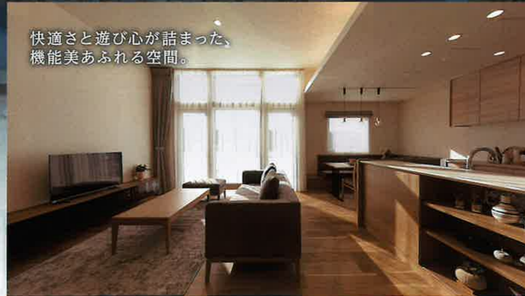
快適さと遊び心が詰まった、 機能美あふれる空間。