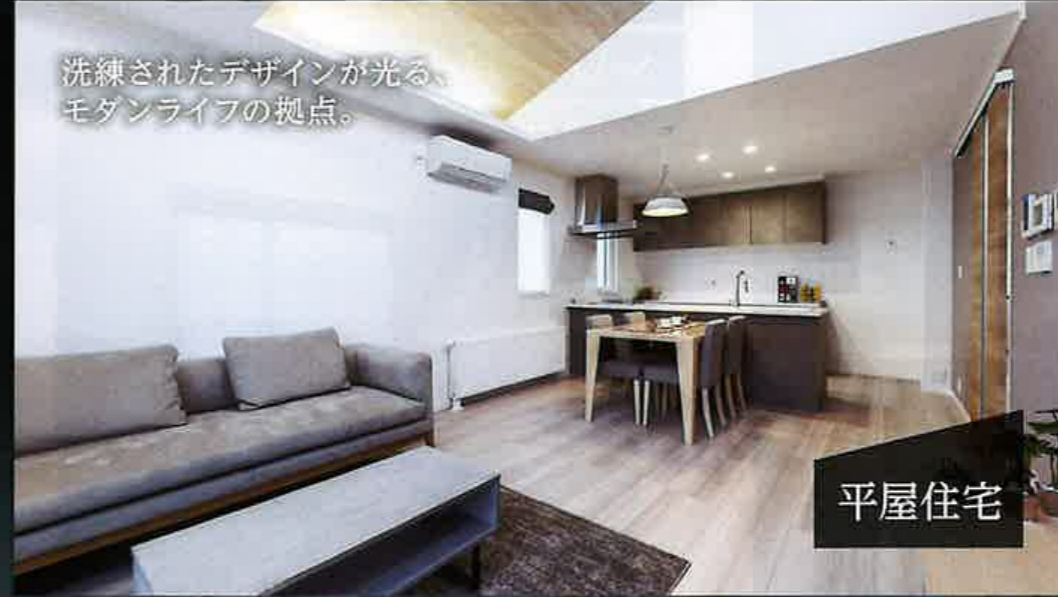
洗練されたデザインが光る モダンライフの拠点。