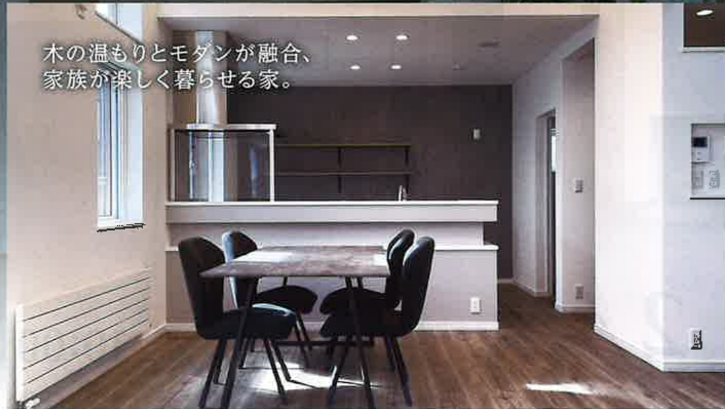
木の温もりとモダンが融合、 家族が楽しく暮らせる家。