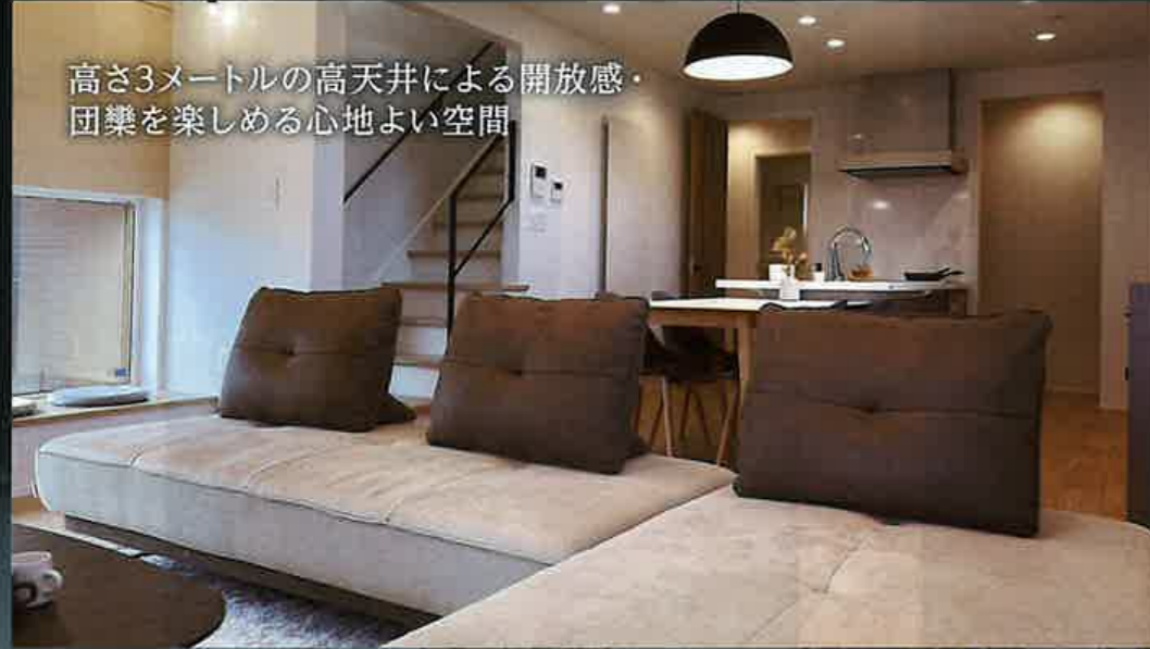
高さ3メートルの高天井による開放感・ 団樂を楽しめる心地よい空間