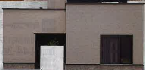
東開町 Sekisui Heim 平屋住宅