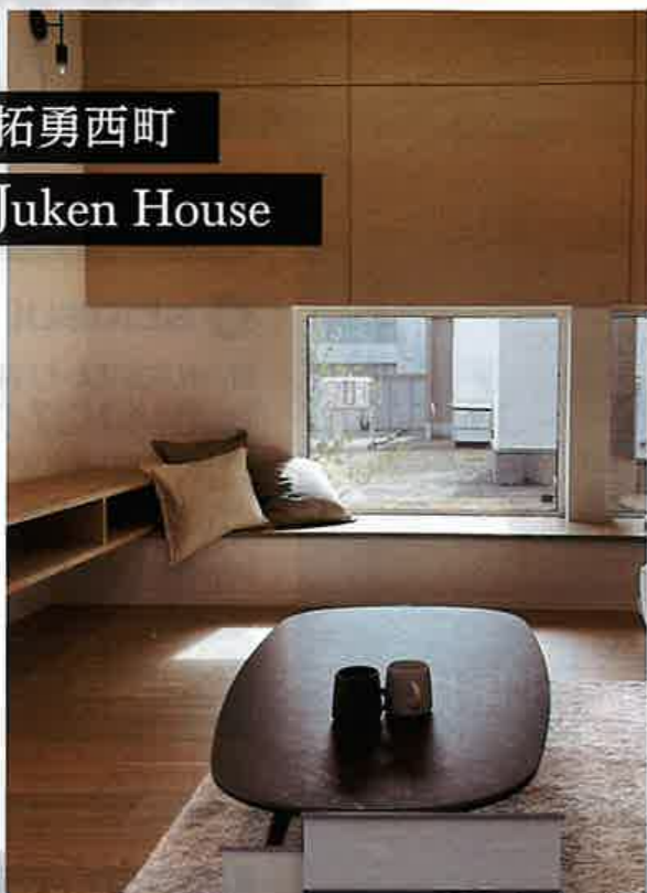
拓勇西町 Juken House