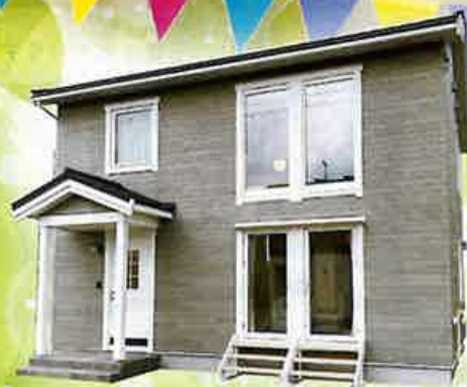
スウェーデンハウス