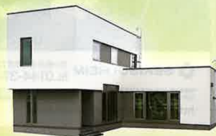
ミサワホーム北海道