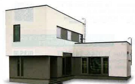
MISAWA ミサワホーム北海道